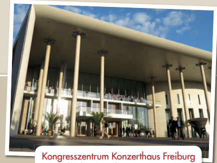
Kongresszentrum Konzerthaus Freiburg Konrad-Adenauer-Platz 1 79098 Freiburg

Wir bitten Sie um verbindliche Anmeldung bis Donnerstag, 13. Juli 2017